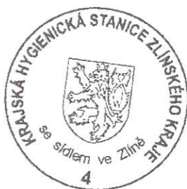
Ing. Gabriela Gabková rada oddělení hluku, EIA a IPPC

Podmínka č. 3 se opírá o požadavek vyplývající z § 5 odst. 11 zákona č. 258/2000 Sb., o ochraně veřejného zdraví a o změně některých souvisejících zákonů, ve znění pozdějších předpisů, ve spojení s § 3 vyhlášky Ministerstva zdravotnictví ČR č. 409/2005 Sb., o hygienických požadavcích na výrobky přicházející do přímého styku s vodou a na úpravu vody, ve znění pozdějších předpisů.